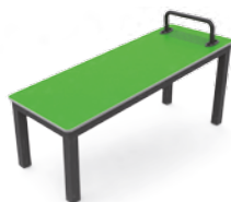
170 PANCA PLURIUSO L. 170cm - P. 70cm - H 100cm