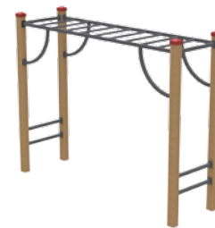
166 SCALA DI SOSPENSIONE L. 218cm - P. 70cm - H 220cm