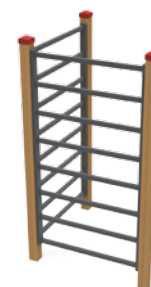
168 SPALLIERA DOPPIA L. 111cm - P. 111cm - H 250cm