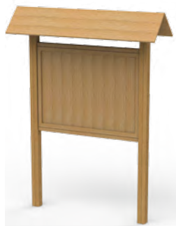
1250 BACHECA LEGNO 170 x 55 x 230