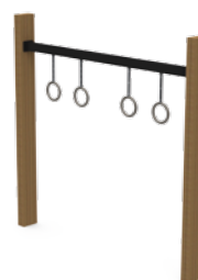
165 STRUTTURA AD ANELLI L. 268cm - P. 18cm - H 220cm