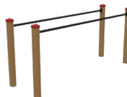
169 PARALLELE L. 218cm - P. 90cm - H 110cm